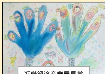
近畿経済産業局長賞