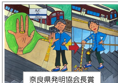
奈良県発明協会会長賞